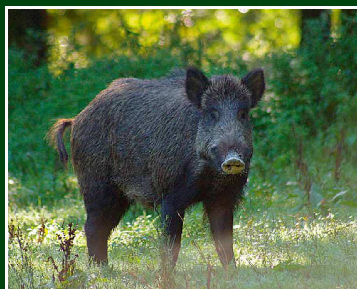
Prase divoké ( Sus scrofa )