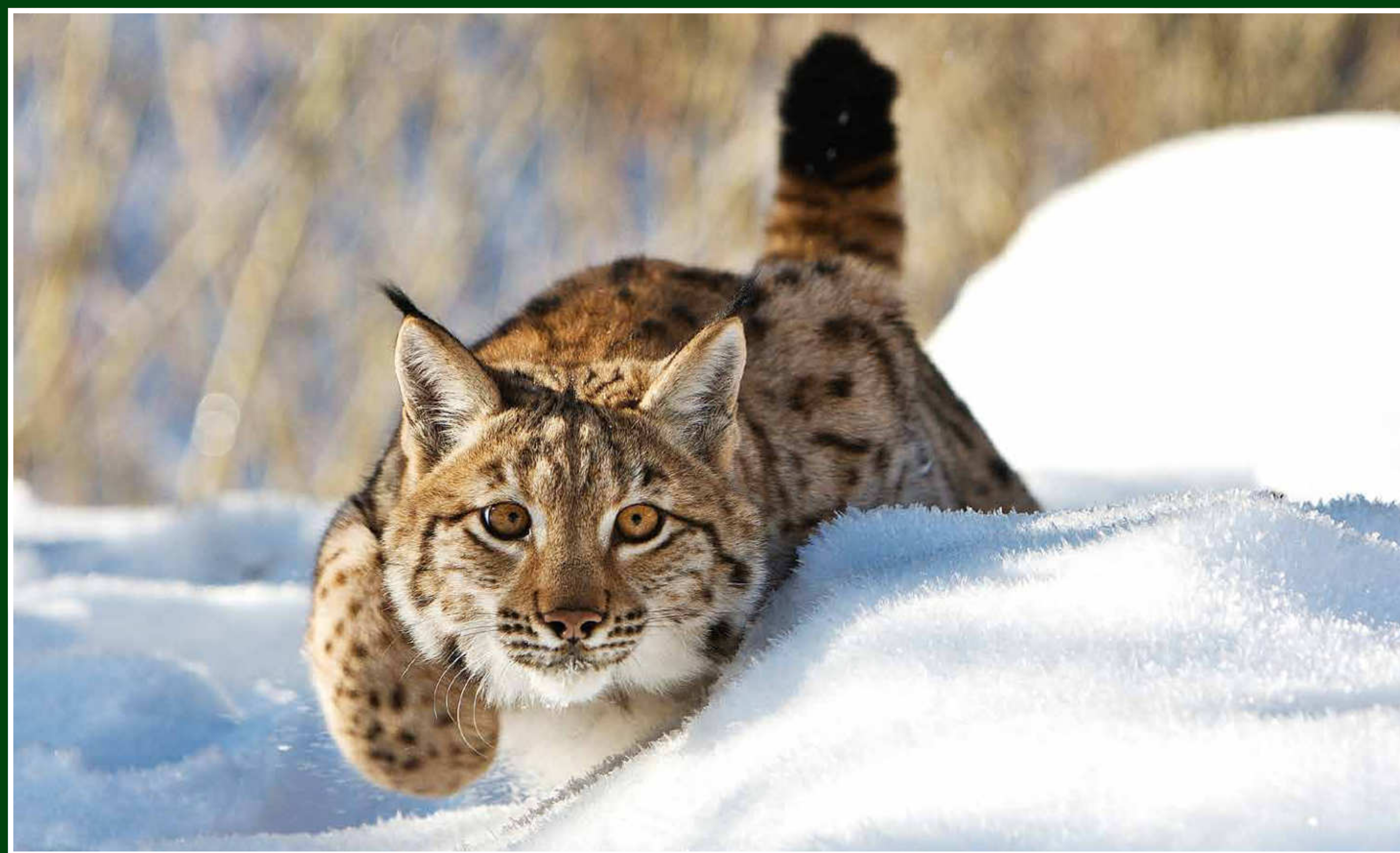
Rys ostrovid ( Lynx lynx )

Potrava – složení potravy se mění v závislosti na roční době, v létě převládá velké množství travin a bylin, v zimním období stoupá v potravě podíl keřů a dřevin (okus výhonků a ohryz kůry mladých lesních dřevin, ostružiník, borůvka apod.) V oblastech s větším výskytem této zvěře může dojít k vážnému poškození mladých lesních porostů. Dostatek energie čerpá jelení zvěř z plodů – bukvice, kaštiny, žaludy, padaná jablka apod.