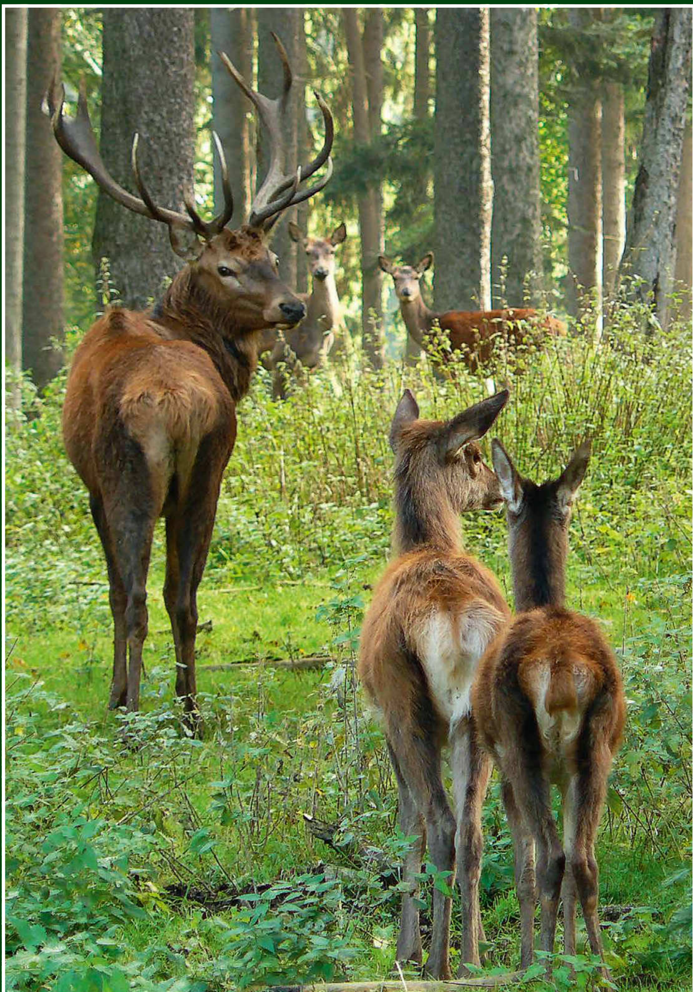
Jelen lesní ( Cervus elaphus )

Potrava: hlavní složkou potravy je spárkatá zvěř, zejména srnčí, ale i černá a vysoká zvěř, dále lišky, zajáci, hlodavci či hmyz.