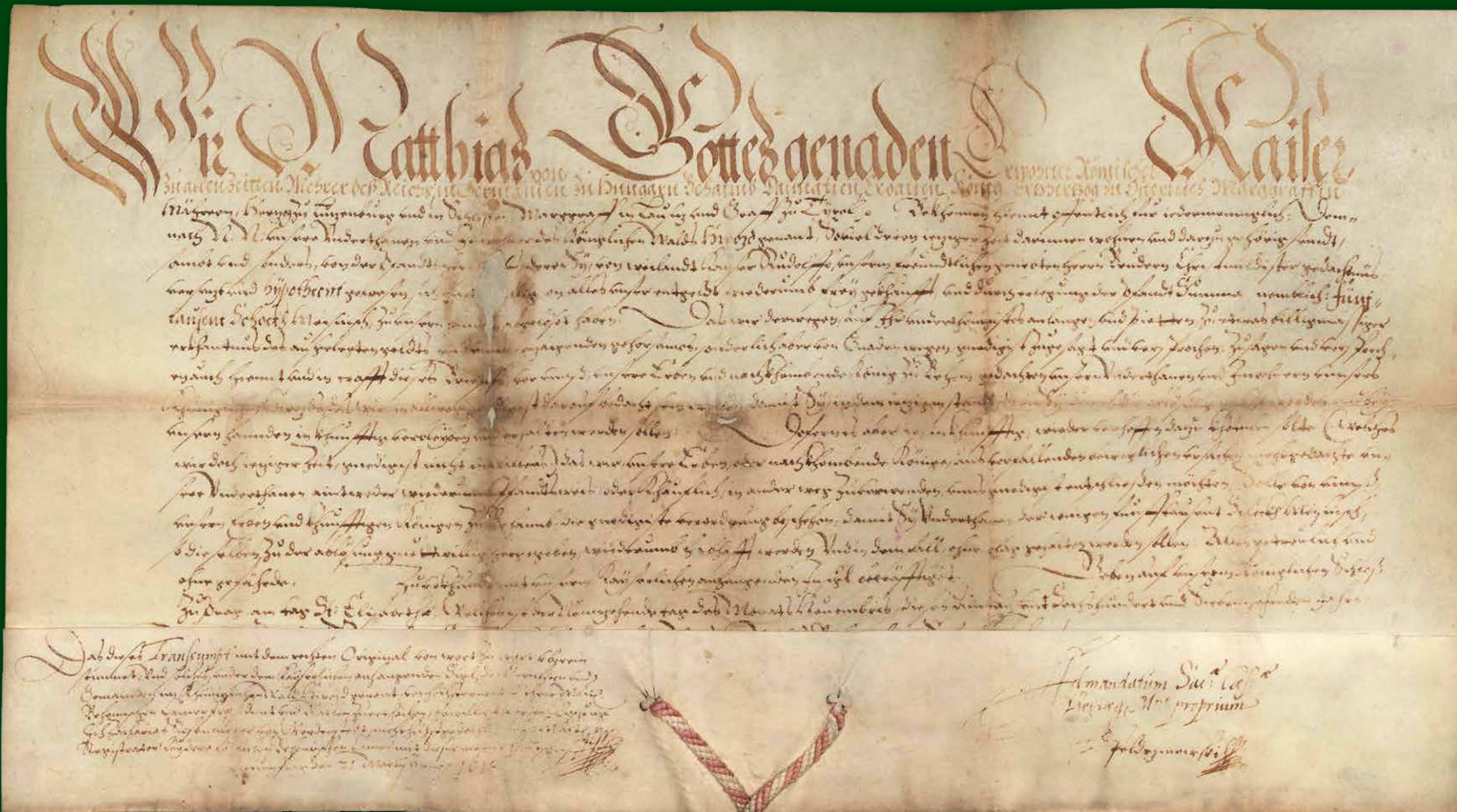
Praha 1617, císař Matyáš potvrzuje, že se Králováci vykopuli ze zástavy za 5000 kop grošů míšeňských, Archiv města Kašperské Hory, inv. č. 40, L40