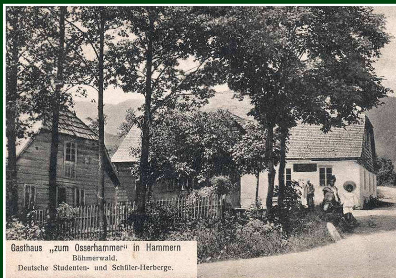
Hamry hostinec „zum Osserhammer“, SOKA Klatovy