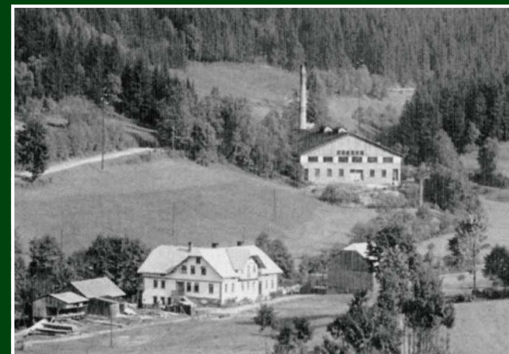
Papírna v Hamrech, dobové foto