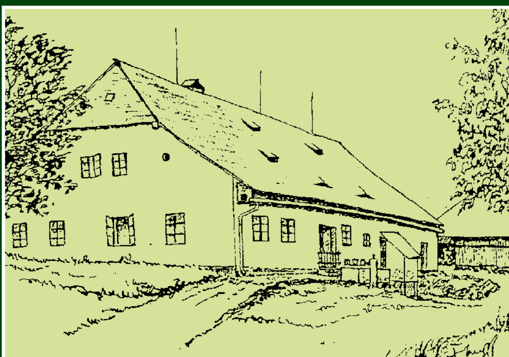
Hamry č. 34 Guberhof

silný citový vztah k Šumavě a k Praze vyjádřil ve sbírce básní: Prag und die Böhmerwald . K jeho prozaickým dílům patří např. Geschichte um ein Waldorf nebo Der alte Böhmerwald – was man sich damals erzählte . Román Die zwölf Nächte von Prag (1942) věnoval Praze.