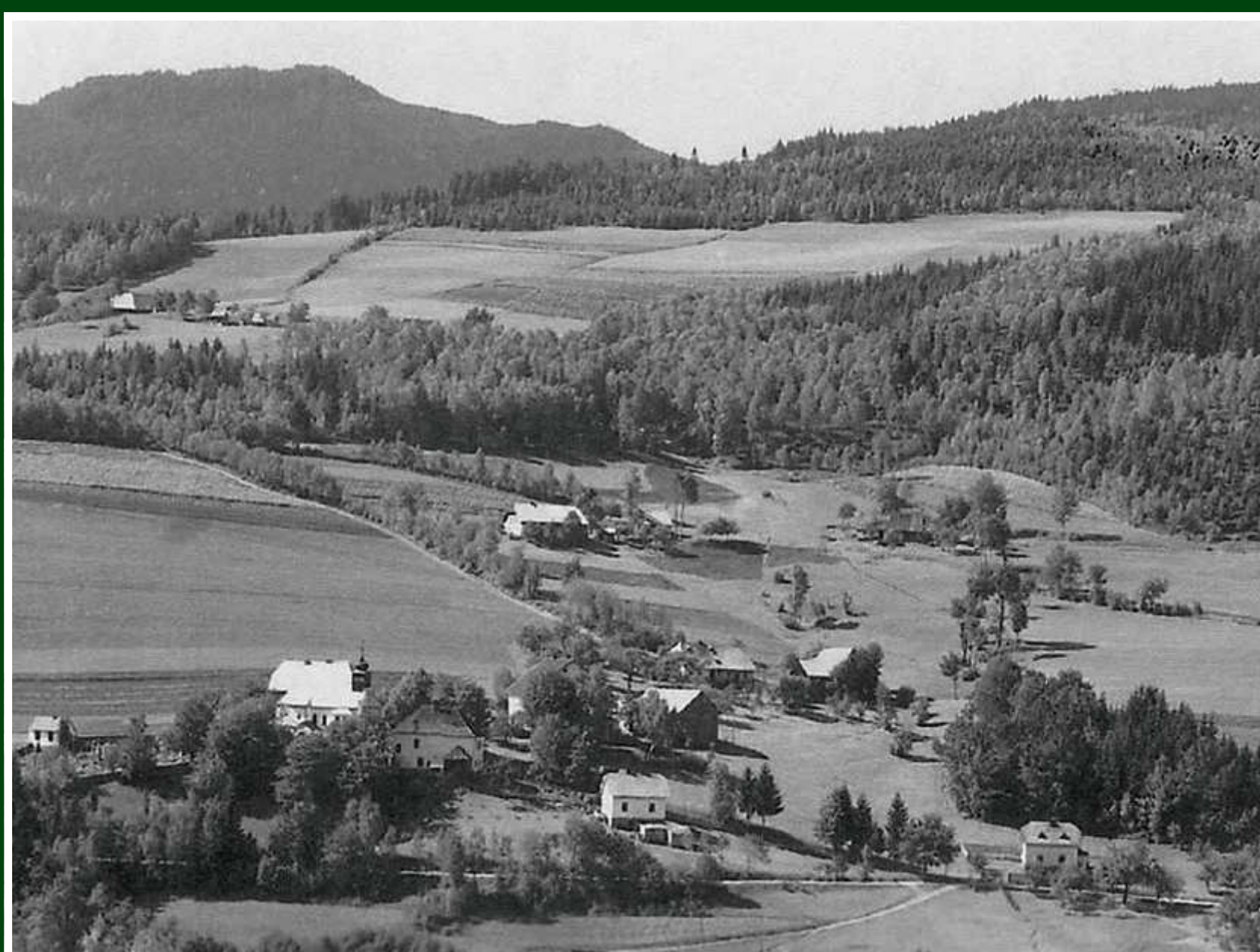
Hamry – dobové foto

N ejstarší písemný doklad o existenci osídlení území dnes nazývané Hamry pochází z roku 1429. Původně jej tvořilo několik roztroušených dvorců podél obchodní stezky zvané Železná, která vedla přes Špičácké sedlo do údolí Úhlavy. Další dvorce vznikaly kolem Úhlavy, později také vysoko pod hraničním hřebenem Královského Hvozdu. Dodnes se dochovaly některé jejich historické názvy, jako např. Fuksenhof, Guberhof, Veithof, Muckenhof aj. Jejich obyvatelé hovořící převážně německy tvořili tzv. králováci. Měli řadu výsad a podléhali přímo panovníkovi (králi).